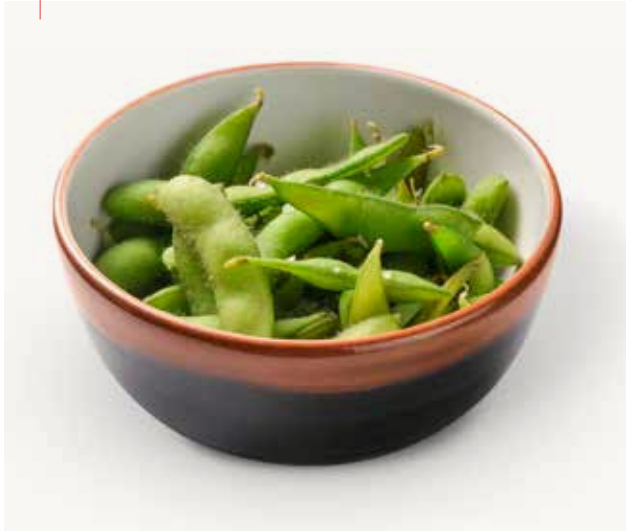
Edamame 5.50 Sojabohnen Soy beans