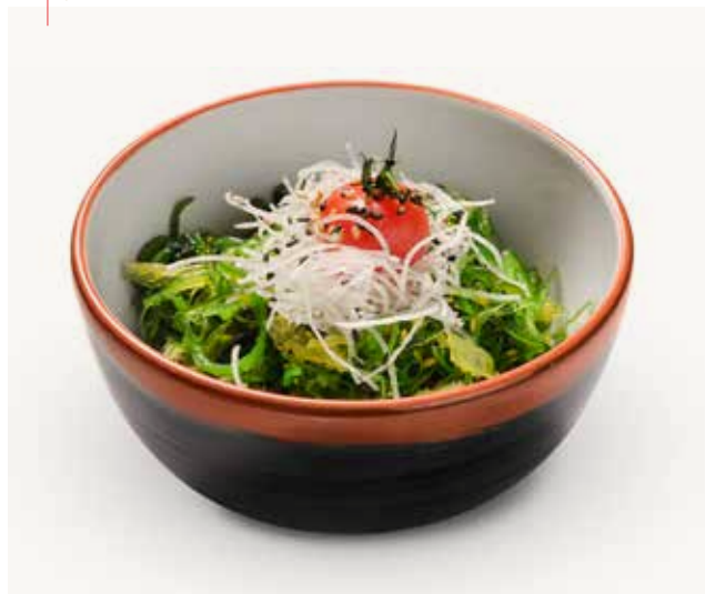
Kaisou salad Algensalat Seaweed salad