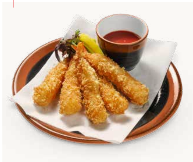
Ebifry to chilisosu 8.50 Frittierte Crevetten Torpedo mit Chilisauce Deep-fried prawns with chili sauce