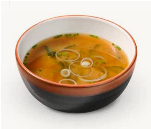
Miso shiru Misosuppe Miso soup